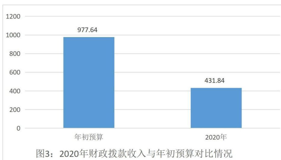
图3：2020年财政拨款收入与年初预算对比情况

本单位 2020 年度一般公共预算财政拨款收入 431.84 万元，完成年初预算的 44.17%，比年初预算数减少 545.8 万元，决算数小于预算数主要原因基本支出中的人员经费年初预算数 840.00 万元暂由市局代管未拨付给我支队。本年支出 126.19 万元，完成年初预算的 12.96%，比年初预算减少 851.17 万元，决算数小于预算数主要原因是：一、基本支出中的人员经费年初预算数 840.00 万元暂由市局代管我支队未发生支出。二、受疫情影响部分工作未按计划开展。